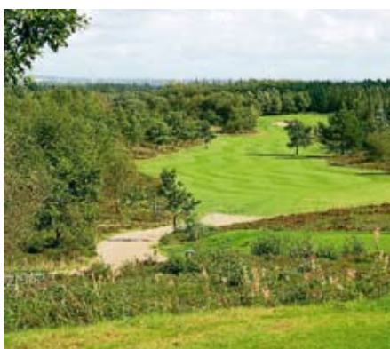
16. tee er det højest beliggende teested i Danmark