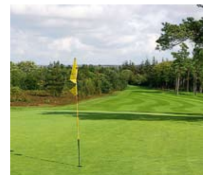
Det smalle 10. hul

og slår ud mellem to søer eller hen over den venstre for at få et kort andetslag op til en lang smal green. Et åbningshul, der med det samme sætter karakteren for banen, idet man er stillet over for forskellige strategiske muligheder, så man kan vælge alt efter temperament og styrker og svagheder i ens spil.