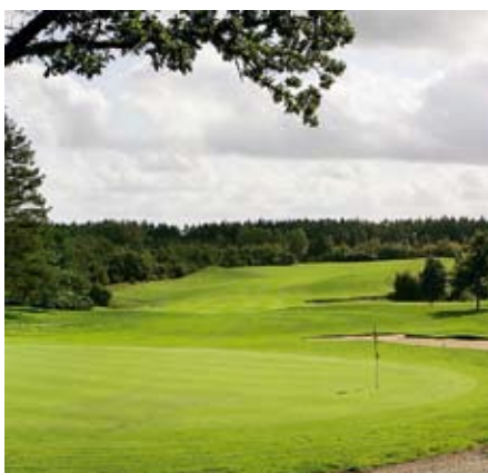
Afslutningshullet på Trehøje er dogleg par 5

>> par 4-hul, hvor man skal tage stilling til, hvor langt ind over lyngen man tør slå sit drive for at afkorte hullet.