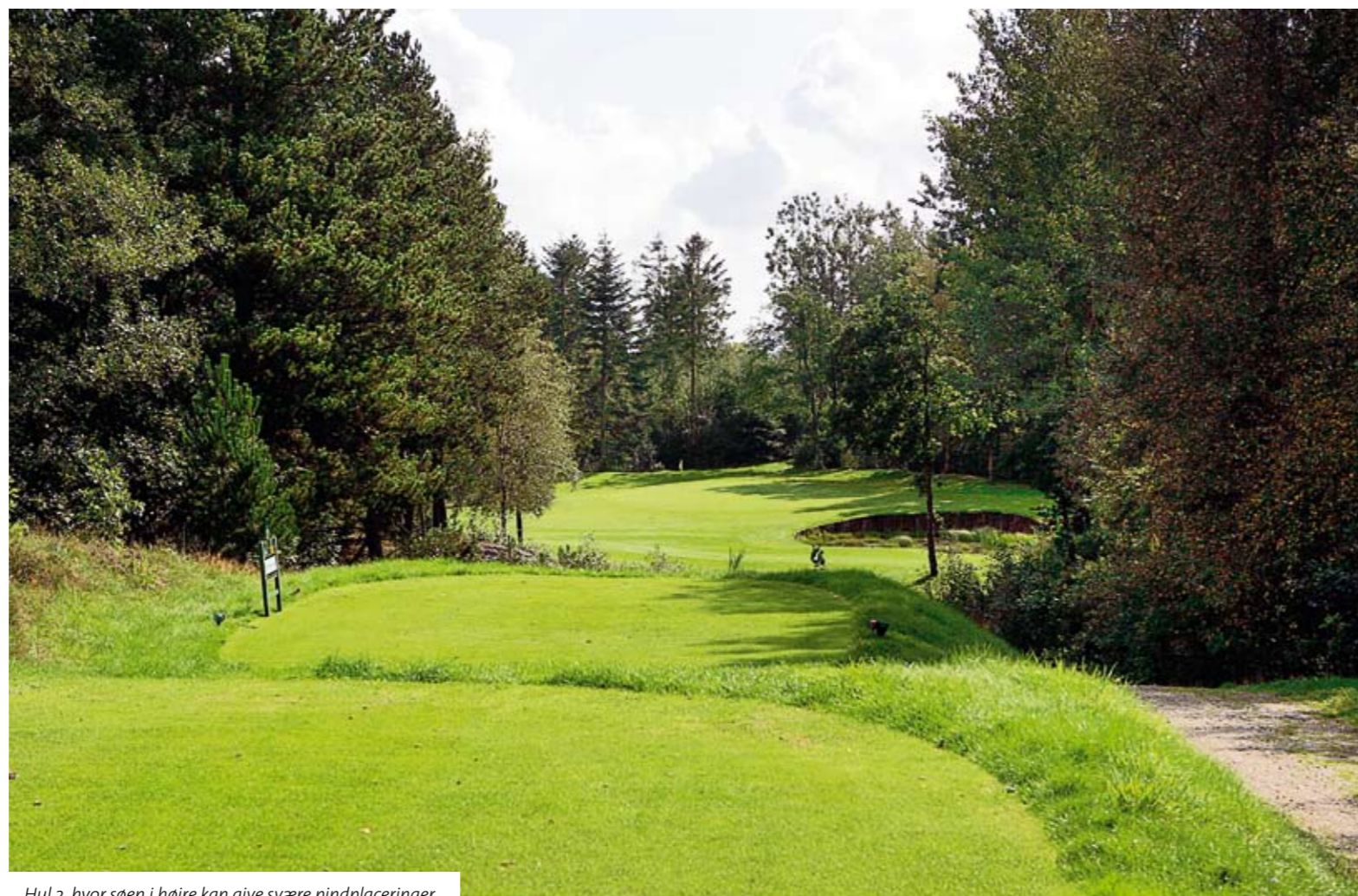
Hul 2, hvor søen i højre kan give svære pindplaceringer