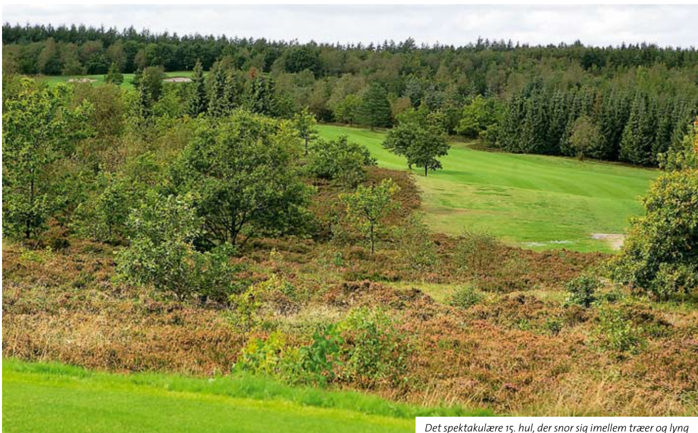
Det spektakulære 15. hul, der snor sig imellem træer og lyng