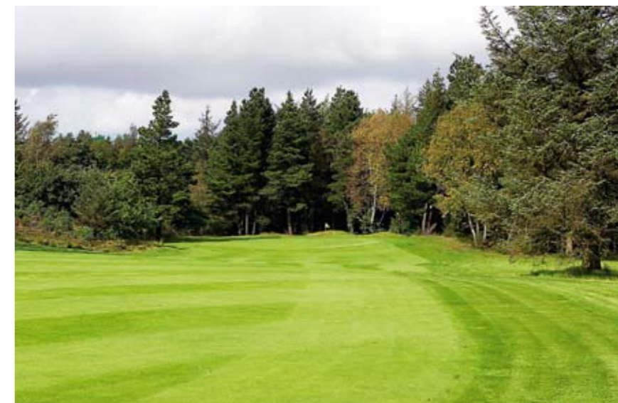
Bag træerne til venstre for 9. green gemmer der sig også en lille sø