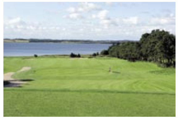
På 1. hul slår man ud med Limfjorden som baggrund