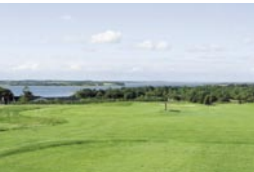
Udsigt fra 9. tee

10. hul er et middellangt par 3 hul, der spilles lidt