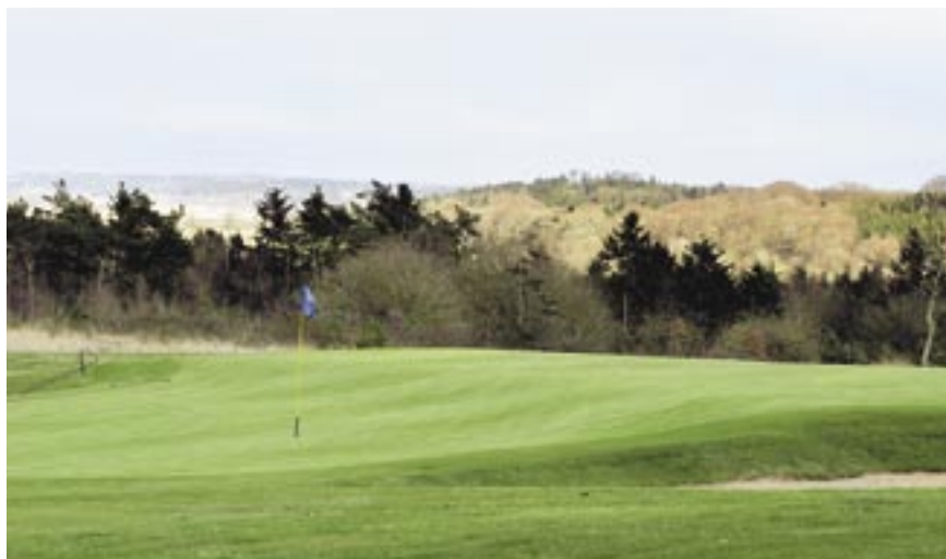
På 24. hul vil de fleste i slaget ind til green få et af de blinde slag, der findes på banen – og på trods her af vil hullet sidde fast på nethinden, som en af banens bedste oplevelser.