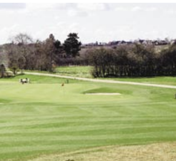
16. hul er ét af banens bedste huller.